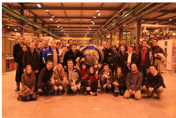
Společná fotografie v CERNU

Zájezdu se zúčastnilo 32 osob, cena byla stanovena na 5600 Kč. Tato akce skončila bohužel finanční ztrátou, počítali jsme totiž s větším zájmem, a tak Spolek musel doplatit rozdíl 14.660,-Kč.