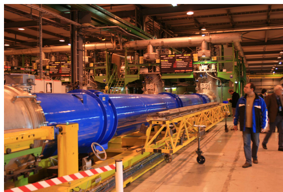
Testované části urychlovače LHC