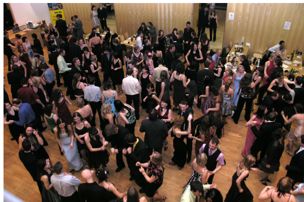
Reprezenační ples PřF v plném proudu