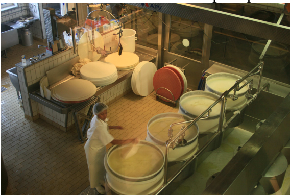
Výroba sýru v údolí Emmentall