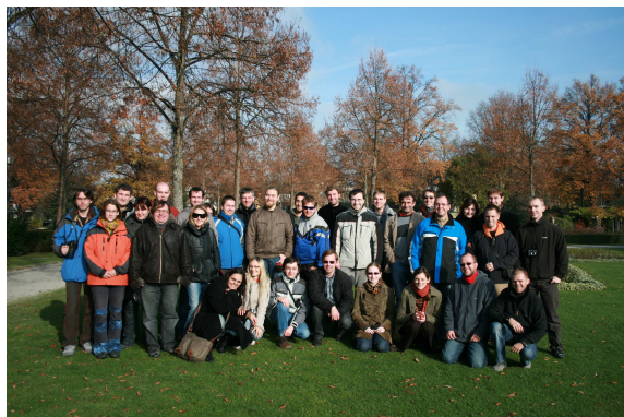
Foto v růžové zahradě v Bernu