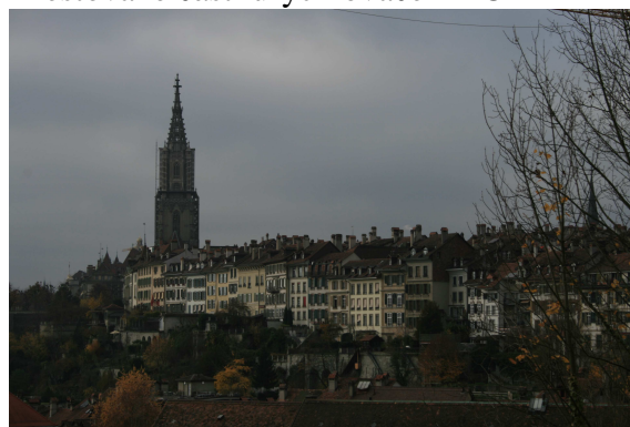
Pohled na Bern od medvědího příkopu