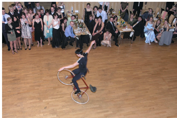
Skvělé vystoupení mistryně světa